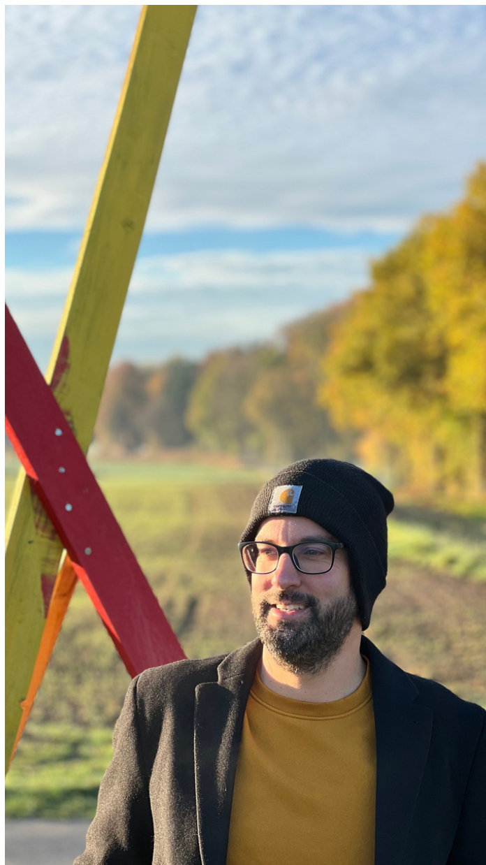
Written by Frithjof Brandt.

Insgesamt waren die Entscheidungen des Samtgemeinderates in dieser Sitzung von großer Bedeutung für die Zukunft der Samtgemeinde Salzhäuser. Die Ernennungen von Führungskräften der Freiwilligen Feuerwehr stellen sicher, dass die Organisation von qualifizierten und erfahrenen Feuerwehrleuten geleitet wird, während die Resolution in Sachen Alpha-E ein wichtiges Signal für den Umweltschutz und die Nachhaltigkeit setzt. Der Nachtragshaushalt zeigt, dass die Samtgemeinde auch in schwierigen Zeiten entschlossen ist, ihre Aufgaben zu erfüllen und in die Zukunft zu investieren.